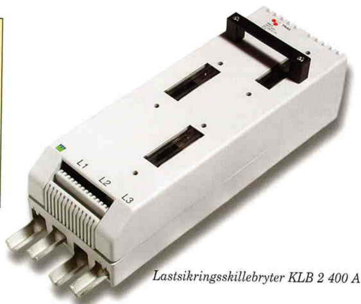
Lastsikringsskillebryter KLB 2 400 A